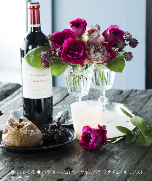
使っている花 ● バラ「ルージュロワイヤル」、バラ「テナチュール」、アストラランティア