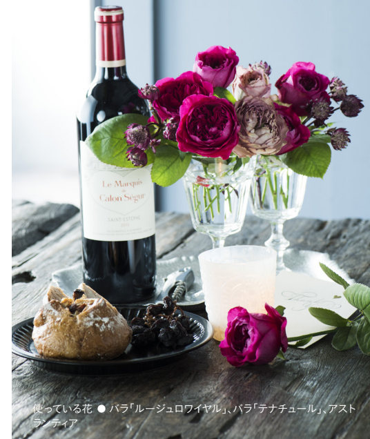
使っている花 ● バラ「ルージュロワイヤル」、バラ「テナチュール」、アストラランティア

晩秋の国産バラは、ボリューム、花色、香り共に素晴らしく、11月22日「いい夫婦の日」にふたりの時間を楽しむ花としてもおすすめです。南米やアフリカの高地で栽培される大輪のバラも多数出回る時期ですが、麗しき香りは国産ならでは! バラの香りは女性に「幸福感」をもたらすとされ、リラクゼーション&美肌効果もあるのです♪