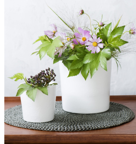
使っている花 ● コスモス、ベビーハンズ、スモークグラス、ビバーナムティナス

渡る風に揺れ咲くコスモスの群れは、日本人が抱く心の景色のひとつ。原産国はメキシコ、スペイン経由で江戸時代末期に日本にもたらされたとのこと、意外にも歴史が浅いのです。メキシコ原産の在来種他、八重咲きタイプやキバナタイプ、チョコレートコスモスなど出回ります。露地栽培が多く、その年の夏場の天候が品質に大きく影響します。