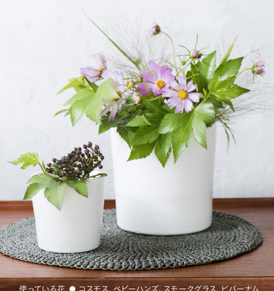
使っている花 ● コスモス、ベビーハンズ、スモークグラス、ビバーナムティナス