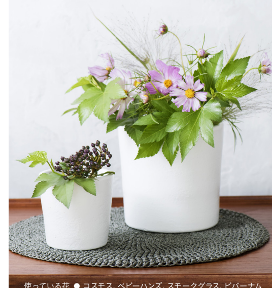
使っている花 ● コスモス、ベビーハンズ、スモークグラス、ビバーナムティナス

渡る風に揺れ咲くコスモスの群れは、日本人が抱く心の景色のひとつ。原産国はメキシコ、スペイン経由で江戸時代末期に日本にもたらされたとのこと、意外にも歴史が浅いのです。メキシコ原産の在来種他、八重咲きタイプやキバナタイプ、チョコレートコスモスなど出回ります。露地栽培が多く、その年の夏場の天候が品質に大きく影響します。