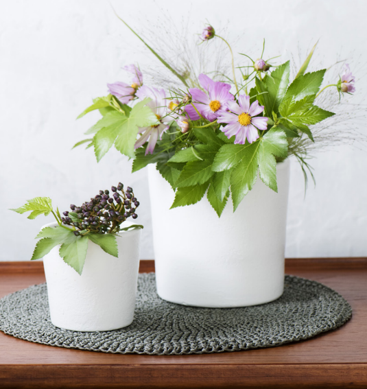
使っている花 ● コスモス、ベビーハンズ、スモークグラス、ビバーナムティナス