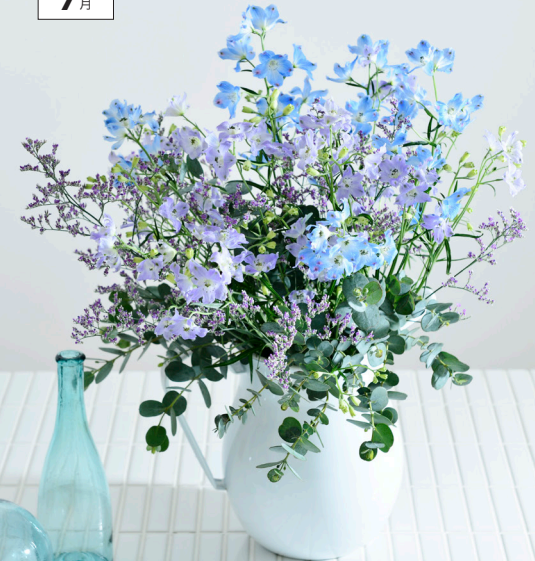
使っている花 ● デルフィニウム(プラチナブルー、スーパーラベンダー)、リモニウム(ブルーウェーブ)、ユーカリ