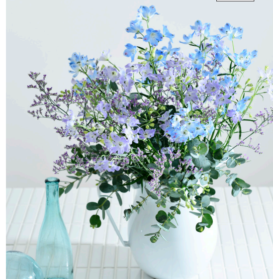
使っている花 ● デルフィニウム(プラチナブルー、スーパーラベンダー)、リモニウム(ブルーウェーブ)、ユーカリ