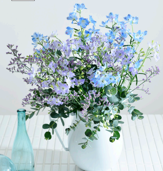
使っている花 ● デルフィニウム(プラチナブルー、スーパーラベンダー)、リモニウム(ブルーウェーブ)、ユーカリ